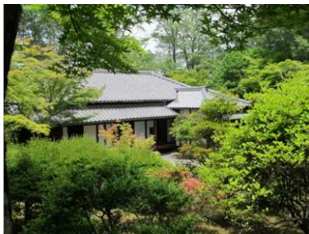
「森鷗外・夏目漱石住宅」全景