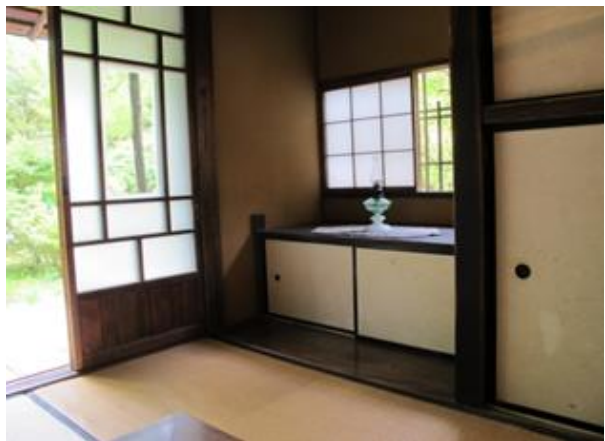
書斎（大きな机を置いていた場所）