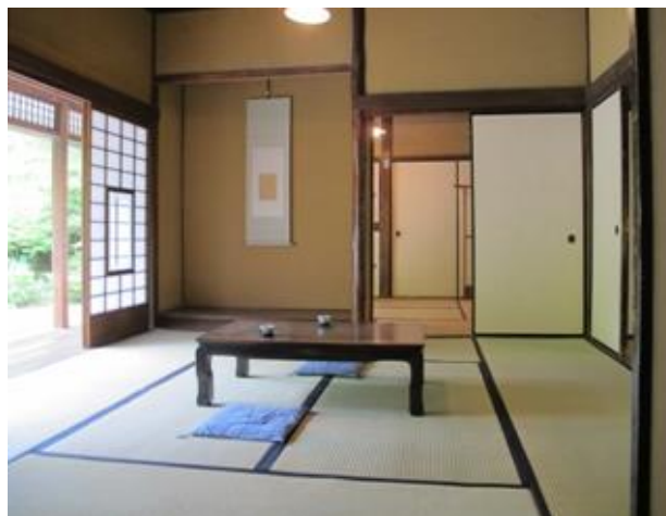
座敷（奥は夫婦の部屋）

この「森鷗外・夏目漱石住宅」は、二人の文豪が住んだというだけではなく、寺田寅彦にとっても忘れ難い貴重な建物であるのです。