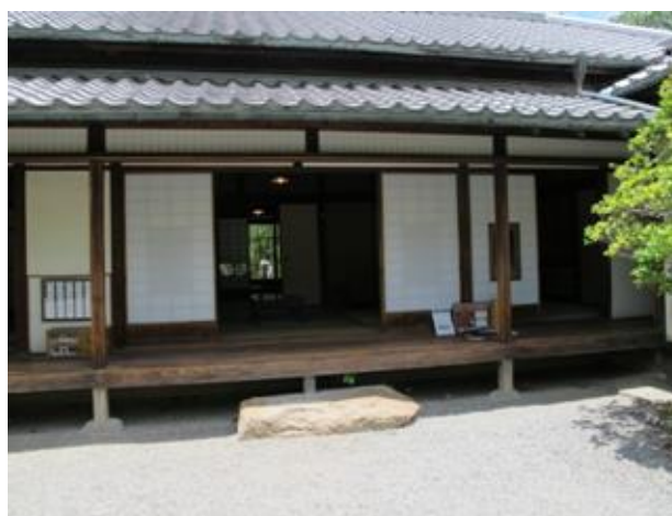
庭から見た座敷（縁側が見える）