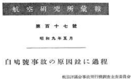
図8 白鳩号事故調査報告書

他の事故は1932年2月27日発生した白鳩号の墜落である。1928年逓信省所管航空会社として発足した日本航空輸送の定期運航便であった双発 Dornier Wal 飛行艇白鳩号が、大阪木津川飛行