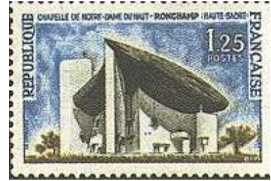
図6 Ronchamp 礼拝堂

土木建設技術者から空気力学研究への転進は、流体力学という視点からはつながるものであった。同じ土木学者で小樽港などの築港の先駆者で関門橋の設計にも携わった廣井勇東京大学は、定年間近「十年若かったならば Eiffel と同じようなことがやってみたかった」と述べたのも、台風による野蒜港の崩壊そして英国における Tay 鉄道橋の落下事故のような風の怖さを知る技術者の心境であった。飛行機のデザインは著名な建築家 Le Corbusier にも影響した。彼の代表作 Ronchamp 礼拝堂の屋根の形は翼に想を得たと言われ、彼自身も飛行機を設計している。