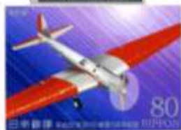
図3 航空研究所 (登録有形文化財(建造物) 中・下:航研機

学内では騒音の問題から用地の選定や関東大震災勅発などあり、本格的活動は1930年に駒場(現在の東京大学先端科学技術研究所)(図3)に施設が完成した後であった。組織は物理部、化学部、冶金部、材料部、風洞部、発動機部、飛行機部、測器部、航空心理部、中央工場にわかれ、物理部には寺田寅彦、冶金部には本多光太郎が所員として参加していた。