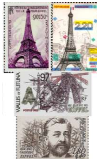
図 5 上: ASME の歴史遺産認定 中: エッフェル塔、下: Gustav Eiffel