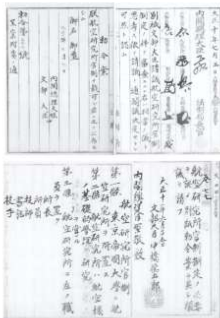
図3 航空研究所官制勅令 (国立公文書館所蔵)

寺田寅彦(図1)は1916年東京大学教授に任命、翌々年航空研究所兼務を命じられた。日本人最初の物理学教授山川健次郎の最初の教え子である田中館は、1907年8月にパリの国際度量衡総会に出席した際に観覧した飛行船に強い印象を受け、日本の将来のために航空の学問の必要を痛感した。自ら委員長となって学内に航空学調査委員会を設置、1918年には航空研究所に発展した。さらに同年7月学部相当の工科大学の附属だった航空研究所は、勅令第270号(図2)をもって学部と対等な東大の附置機関となり、所員は研究を専門とする教授職という新しい制度であった。研究所は、航空機の基礎的学理に関する研究を行い、対象は航空機、航空船、気球、航空用発動機であった。